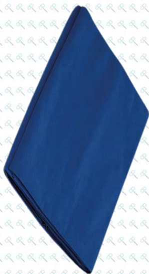
MUESTRA DE TEXTURA

Elaborados con tela no tejida de polipropileno, resistente a la tensión, repelente a líquidos, proporciona una barrera bidireccional y más eficiente evitando el paso de microorganismos patógenos, tanto para el paciente como para el personal de salud durante los procedimientos quirúrgicos.