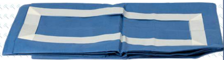
*Imagen representativa del producto que puede variar según la temporada e inventario.

Elaborado con tela no tejida de polipropileno, resistente a la tensión, repelente a líquidos, proporciona una barrera bidireccional y más eficiente evitando el paso de microorganismos patógenos, tanto para el paciente como para el personal de salud durante los procedimientos quirúrgicos.