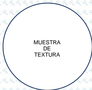
MUESTRA DE TEXTURA