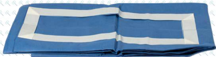
*Imagen representativa del producto que puede variar según la temporada e inventario.

Elaborado con tela no tejida de polipropileno, resistente a la tensión, repelente a líquidos, proporciona una barrera bidireccional y más eficiente evitando el paso de microorganismos patógenos, tanto para el paciente como para el personal de salud durante los procedimientos quirúrgicos.